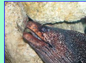
Morena Punteada ( Gymnothorax dovii )