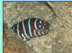
Morena Zebra ( Gymnomuraena zebra )